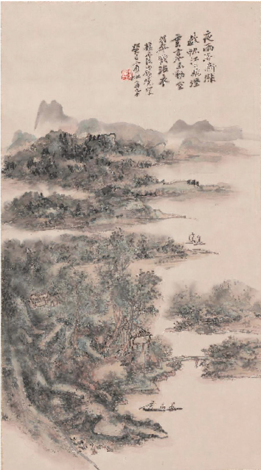
黄宾虹 栖霞岭晓望图 71.5×39.5cm 中国画 1953年 中国美术学院美术馆藏