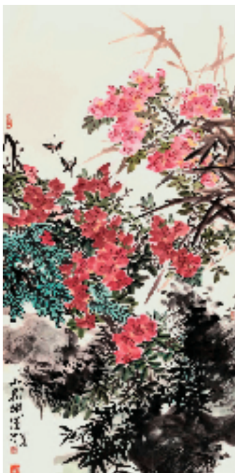
缪宏波 山花烂漫 138×69cm