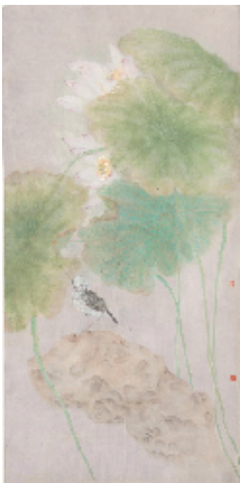
叶芄 翠叶催凉 138×68cm