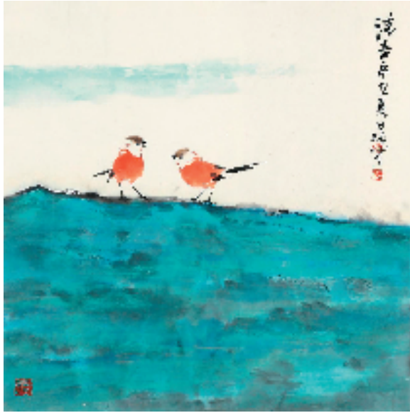
田源 清音 68×68cm