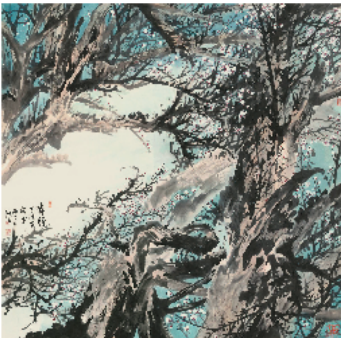
缪宏波 香静 125×125cm