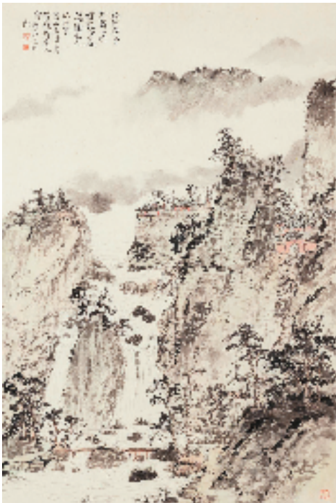
林海钟 冷然希音图 74×49cm