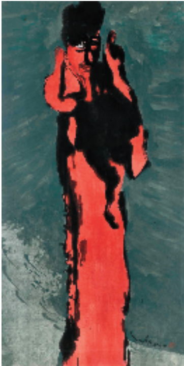
徐默 浪人 136×68cm