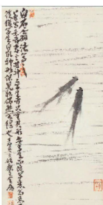
窦金庸 拟白石石意 45×22cm