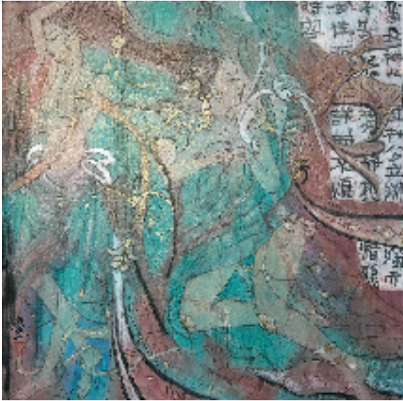
顾迎庆 奋长袖以正衽 69×69cm