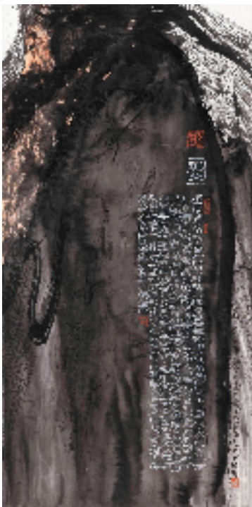
徐默 屈原 136×68cm