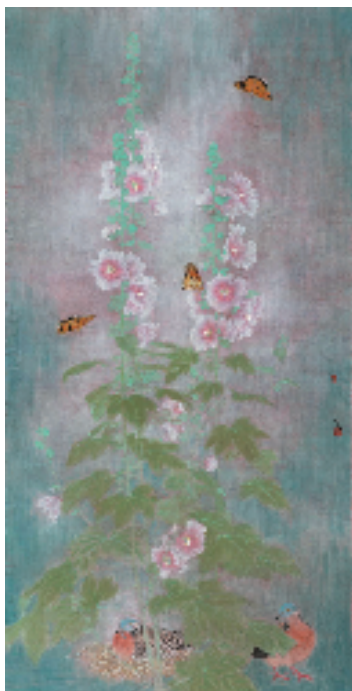
叶芄 铺殿花·葳蕤 138×70cm