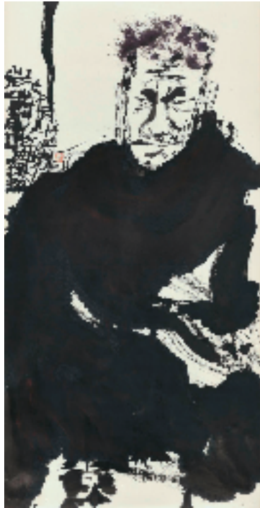
徐默 男人像 138×70cm