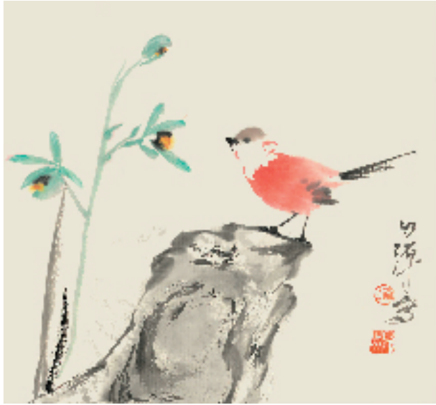
田源 小品 32×34cm