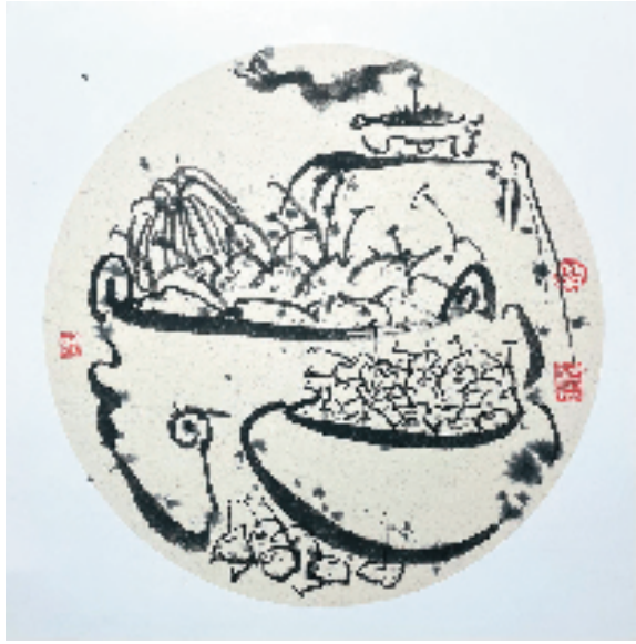
司文阁 清供纳福 38×38cm