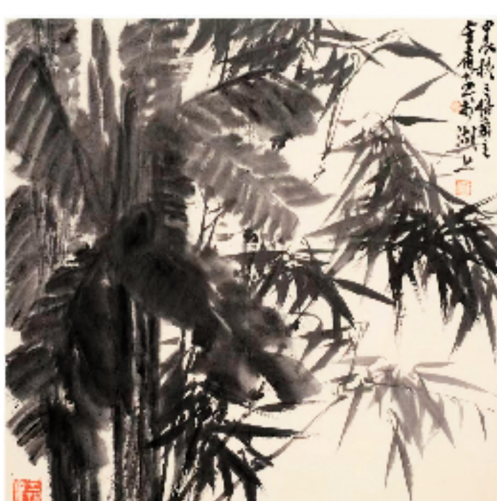
窦金庸 秋露 68×68cm