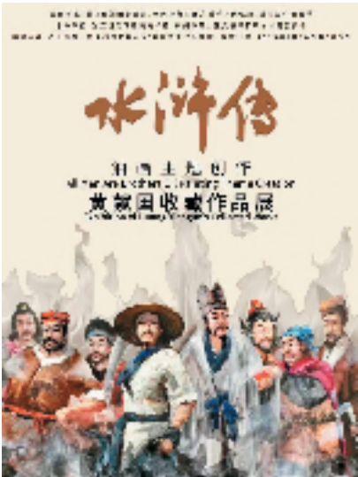
展览海报设计陈保旬