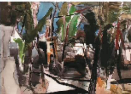
周刚 山西高平郭家庄风景 75x100cm 水彩画 2018年

两位艺术家的作品都有着各自强烈的艺术风格。俞晓夫作为“魔都”的画家,他的作品很洋气,周刚出身于陕西,他的作品也自带黄土高原的“土味”。与此同时,他们都根植于中华民族的本土意识,俞晓夫的作品有着大写意的境界,周刚的水彩画也大气、硬朗,具有本土现实主义风格。此次,他们的作品在展馆中展开了对话。观众在欣赏作品时,不仅能体会到他们艺术思想的碰撞,还能领略到不同创作手法带来的视觉冲击。