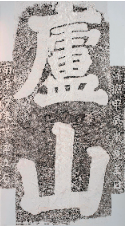
南宋 朱端章 庐山

展览包含“山水·志地寓怀”“文学·文体兼备”“书院·文以载道”“隐逸·逸世流风”“书法·书圣名闻”“宗教·弘法传道”“史事·记往知来”七个篇章。其中,“山水篇”以秀峰景点的题刻为案例,从铭地名、记山水、镌游玩、寓情志四个方面,展示庐山的山水文化;“文学篇”以观音桥、玉渊潭、谷帘泉等景点的题刻为案例,从题诗、题识、题记、记叙、古文、墓志、联语等七种文学体式,展示庐山的文学底蕴;“隐逸篇”以醉石景点的题刻为案例,从陶渊明隐逸思想及其影响的角度,展示庐山的隐逸文化;“书法篇”主要以归宗寺景点的题刻为案例,从王羲之与庐山传闻到宗鉴堂法帖的刻制,展示庐山的书法文化;“书院篇”以白鹿洞