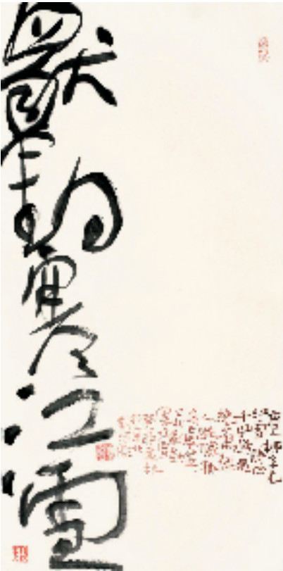
刘洪彪 唐·柳宗元《江雪》 69x34cm 2023年

刘洪彪,字后夷,号逆坂斋,1954年生于江西萍乡。中国书法家协会第七届副主席、草书委员会主任,中国文学艺术界