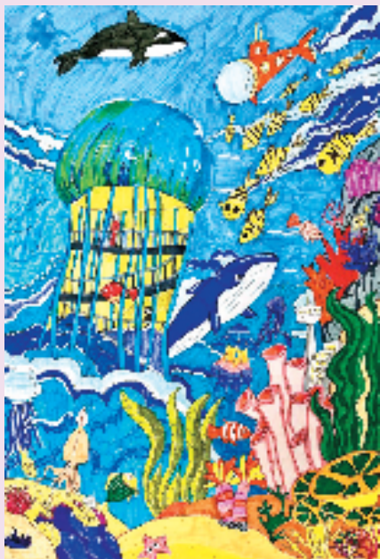
爻艺宸 奇妙的海底世界