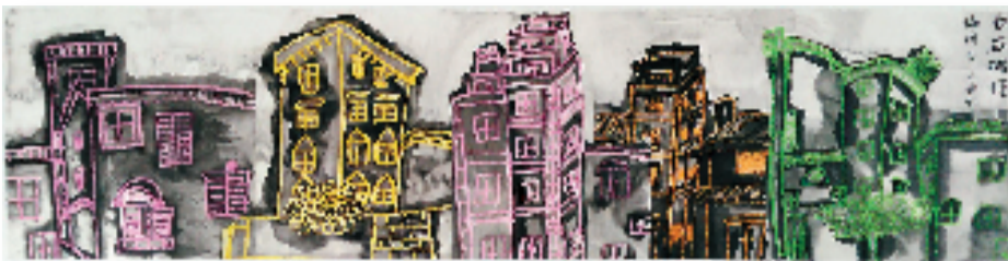
谢明玉 方妙红(11岁) 白石碉楼 33×138cm 实验水墨