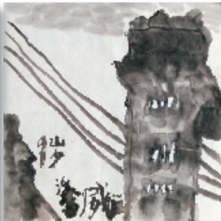
潘威远(9岁) 白石碉楼 33×33cm 水墨