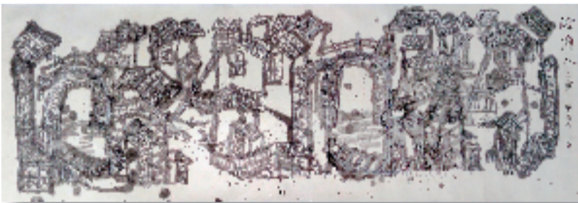
骆美华(11岁) 岭南水乡 60×180cm 实验水墨