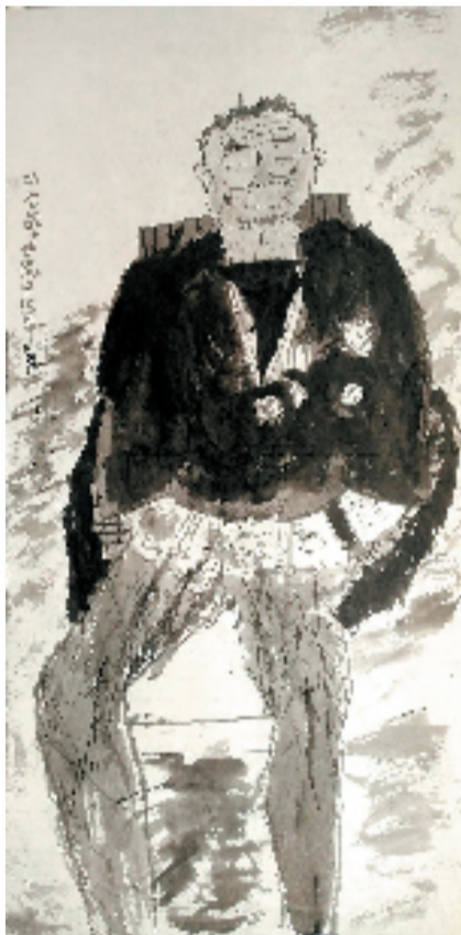
陈映霖(9岁) 听老战士讲“抗战故事” 55×180cm 水墨