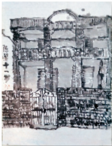
陈馨(11岁) 三乡老房子 33×55cm 水墨