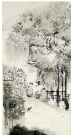
黄采珏(11岁) 农家乐 138×67cm 水墨画