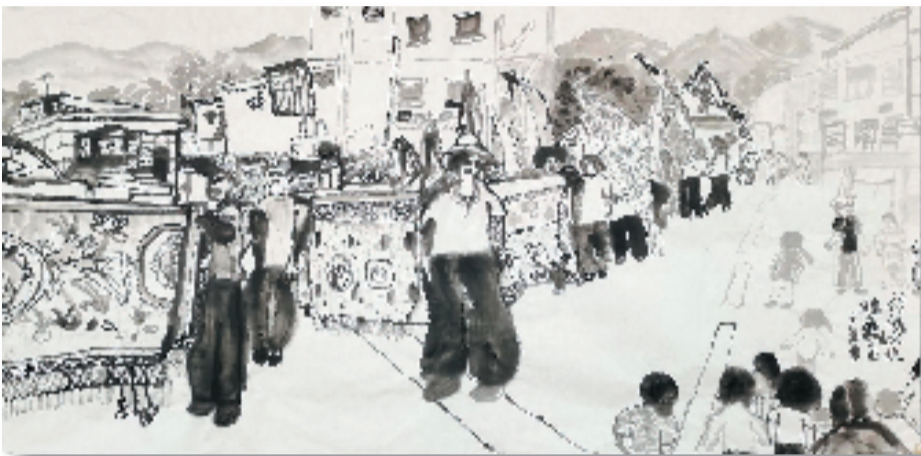
黄钰玲(9岁) 鸦岗飘色 67×138cm 水墨