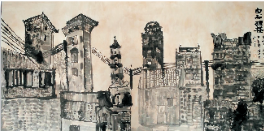
王诗芸 郑可欣 周旭冉 尹荟婷 张仕淇(10岁) 白石碉楼 248×129cm 水墨