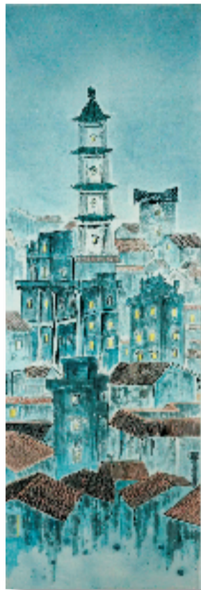
魏昊(10岁) 三乡古建筑群 60×180cm 水墨