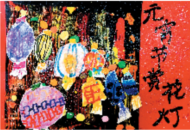
▲李金泽(浙江省义乌市嘉鸿幼儿园) 赏花灯 作品色彩鲜艳、富有节日氛围,小画家通过涂鸦和剪贴的方式表达了元宵节赏花灯的传统习俗。灯笼的多样设计和丰富颜色展现出孩子们的创造力和对节日的喜爱。画面中的背景涂抹与精细的灯笼剪贴形成对比,增添了作品的趣味性和艺术效果。