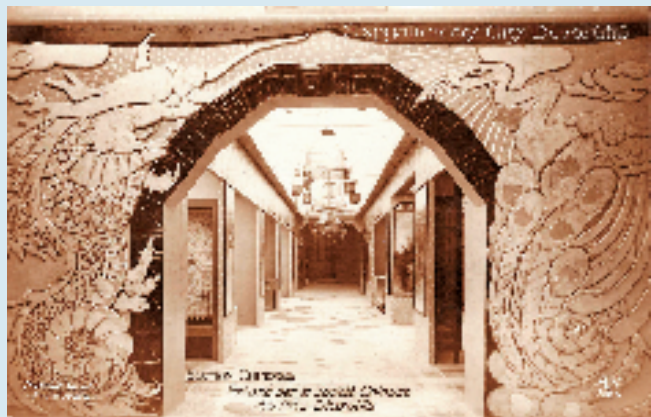
刘既漂 中国馆大门 1925年