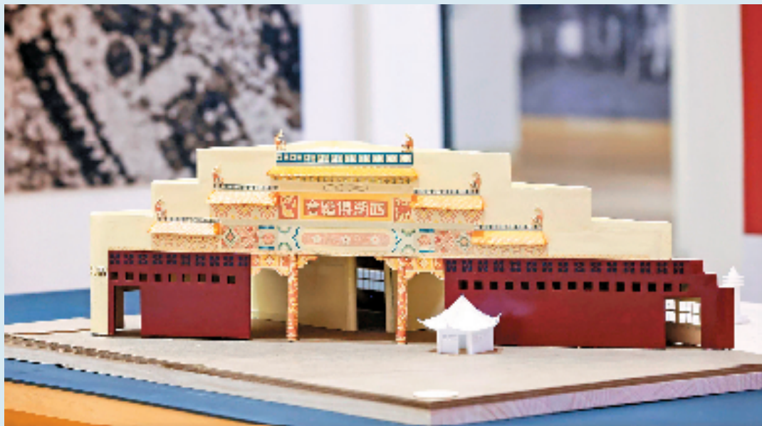
西湖博览会大门头模型 比例:1:50 木材、SLA树脂3d打印等 中国美术学院建筑艺术学院模型小组

刘既漂先生是中国20世纪初设计、建筑、策展等多个领域的先驱。他于1919年赴巴黎学习绘画。1922年进入巴黎高美,后转学建筑。1924年,他在参与创办“霍普斯会”的同时,还创办了首个设计类海外艺术家学会“美术工学社”。1925年巴黎装饰艺术与现代工业博览会上,刘既漂是中国馆的总设计师。1928年,他与林风眠等共同创建了中国首个国立高等艺术学府“国立艺术院”(现中国美术学院)任图案系(设计学科的前身)主任,并负责罗苑校舍的改造设计。