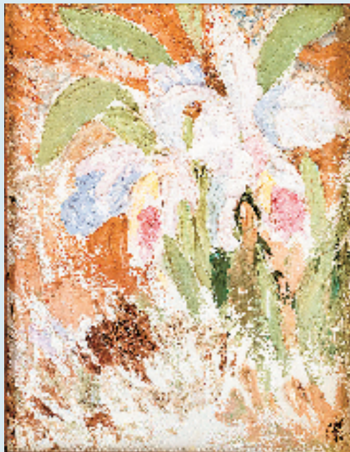
刘既漂 花朵 53×43cm 纸本 1960年 刘既漂家族档案馆藏

第一部分“志趣转向:巴黎高美的学艺青年”聚焦于刘既漂在巴黎美术学院的学习经历,从绘画到建筑的兴趣转向,探讨他将美术、建筑与装饰艺术融合于一体的艺术风格是如何形成的;第二部分“大美术观:霍普斯会与美术工学社”通过1924年斯特拉斯堡中国美术展览会,展示了其绘画和设计如何融合东方美学与法国现代艺术,以及他推动纯粹艺术进入日常生活的设计创造。