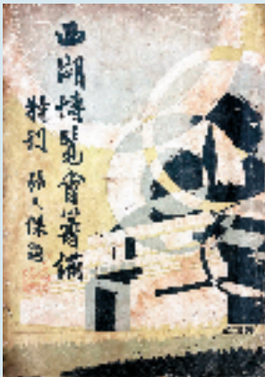
刘既漂设计封面 西湖博览会筹备特刊 16×24cm 纸本 1929年 西湖博览会博物馆收藏

作为海内外首个刘既漂个展,此次展览由中法团队联合策划,共展出海内外展品400余件,其中包括许多珍贵的原作,多数展品为首次公开亮相;以丰富生动的内容展现了第一代留法中国艺术家中设计和建筑方向的代表刘既漂的设计艺术创作与思想。