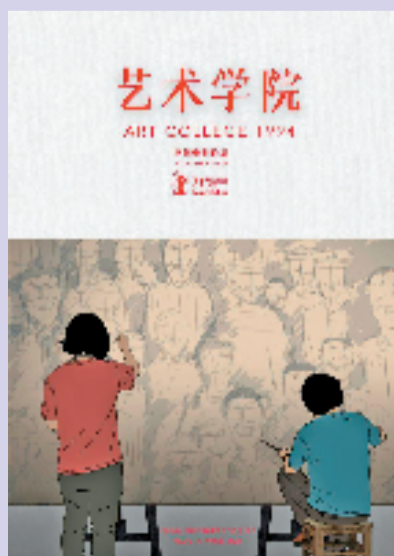
动画电影《艺术学院1994》海报

今天的中国动画在发展周期上正在步入一个新的时代，动画工业的金字塔已经初步形成，这对动画人、动画企业以及政府扶持机构来说都是新的起点和新的发展机遇。对于动画企业而言，如何面对即将到来的千亿电影市场（动画的市场份额将达到20%），并从中能够分得“一杯羹”，是接下来要认真准备、思考并面对的事。