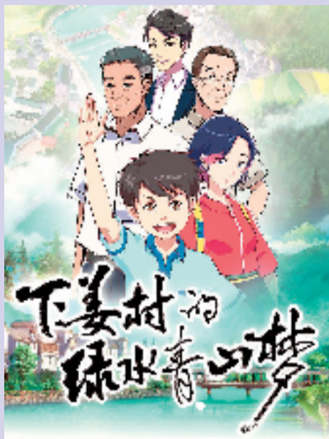
动画片《下姜村的绿水青山梦》海报