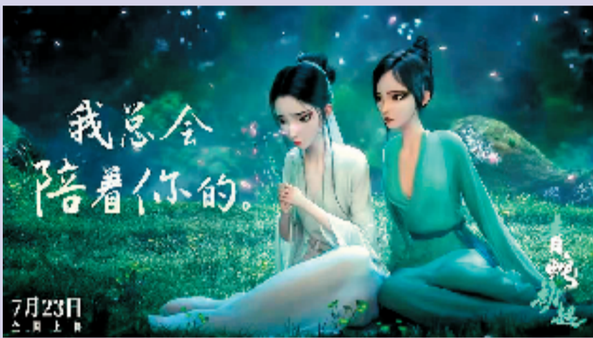
动画电影《白蛇2：青蛇劫起》海报

大锅饭，这个公司分一点，那个公司分一点，没有大的资本支持。不仅如此，人才和机遇都是缺一不可的，确实是要方方面面都在火候上，才有出现下一个饺子导演、下一部精品的可能。”