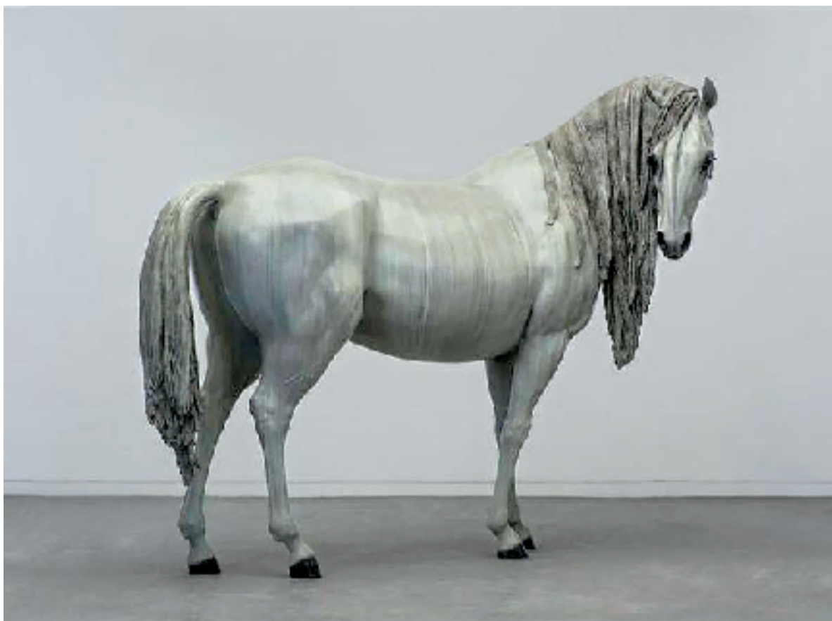
向京 异境——这个世界会好吗 215×265×120cm 玻璃钢着色 2011年

施慧将传统纤维工艺转化为具有哲学深度和诗性的当代艺术语言。《书非书》系列以宣纸和纸浆为基底,将书法结绳记事的原始意象与纤维编织结合,既保留水墨的流动感,又赋予材料雕塑般的空间张力。其作品《老墙》则用棉线与纸浆复现江南古墙的斑驳肌理,通过材料的柔性质感消解传统建筑结构的坚硬属性,形成柔化历史的美学表达。她擅长从中国传统文化中提取元素,如园林假山、本草纲目、碑刻文字等,将其转化为具有当代性的视觉符号。《本草纲目》系列将风干的中药植物与宣纸结合,既呼应古代药典的博物学精神,又通过材料的自然衰变隐喻现代工业文明对传统的侵蚀。这种以物载道的创作理念,突破了纤维艺术的装饰性局限,使其成为文化记忆的载体。她通过纤维艺术挑战性别与文化的刻板印象。《结》系列将传统女性家务劳动(编织)升华为公共艺术,既承认女性角色的历史贡献,又以抽象形式消解其工具性,赋予其哲学意涵。她曾指出:“纤维材料的温情与母性温柔存在天然联系,但艺术应超越社会建构的标签,直指人性共通的情感”。