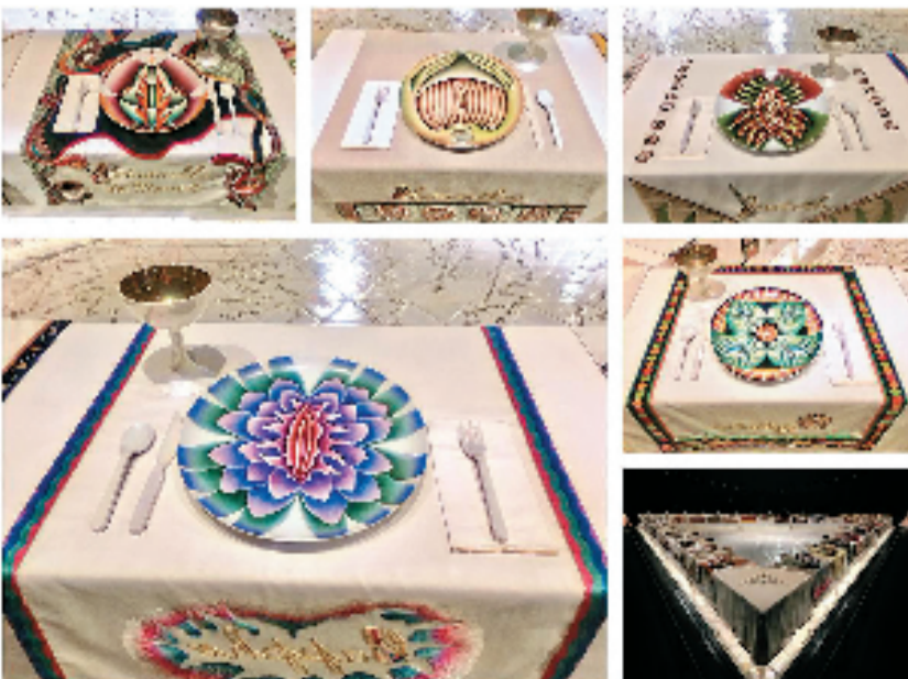
朱迪·芝加哥 晚宴 1979年

女性艺术的自我价值实现之路,最终指向人类精神的共同解放。格里塞尔达·波洛克主张的解构天才神话与重建差异评价体系,需与数字时代的公众参与相结合——当每个人皆可成为历史的书写者,当伟大的定义向多元敞开,艺术史会真正成为共生的记忆。