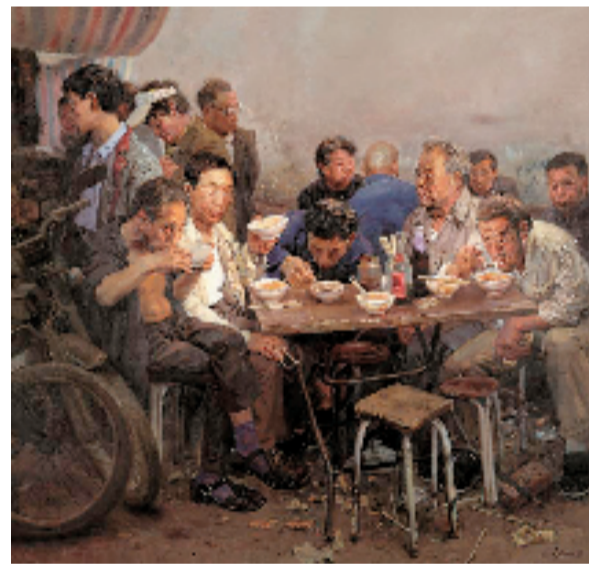
忻东旺 早点 190x200cm 布面油彩 2004年

号，而是带着生活褶皱与人性光辉的“真实存在”。他的创作，是对“现实主义”的当代诠释，这种创作精神，也为我们重新审视艺术与时代的关系提供了启示。