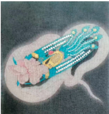
沈春妮 碧鳞点翠 23x23cm