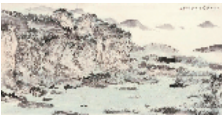
林海钟 东坡赤壁图 70x137.5cm

沈岳的作品构思独特,用多元的手法将“桃花源系列”展现得淋漓尽致,作品表现形式多变而生动,在视觉上有很大的冲击力,具有个人鲜明的艺术特色。阿海将偶然性与随机性融入画面,创造出斑驳淋漓的视觉效果,看似无序的表达,实则是对秩序与和谐的深层探索。林海钟的山水画线条苍劲柔美,皴染变化