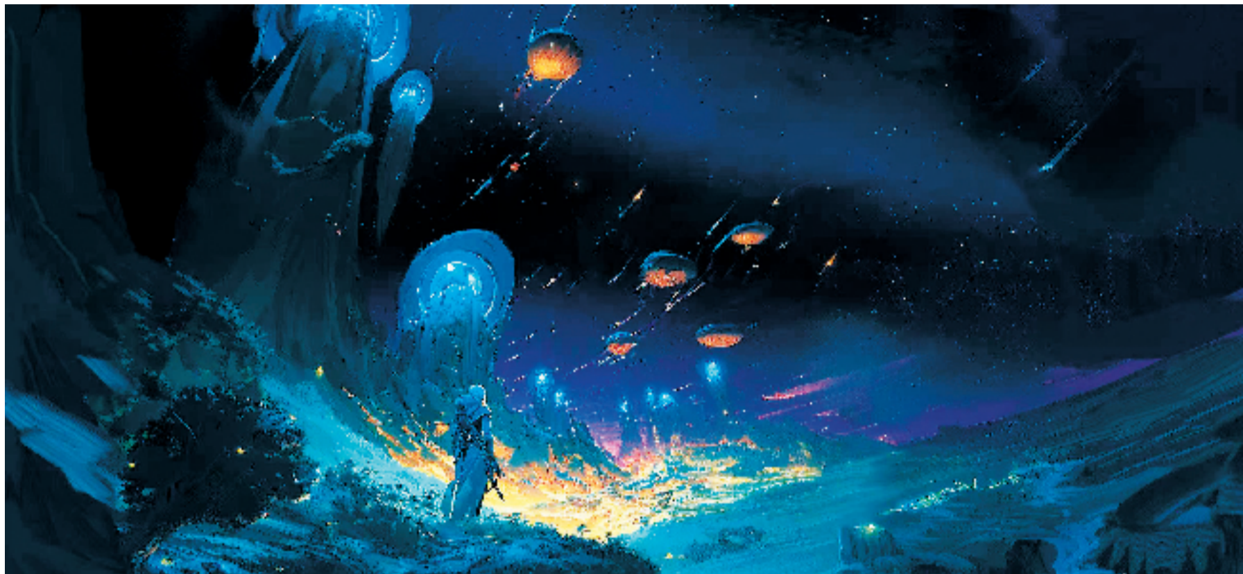
跨越星河的守望之旅