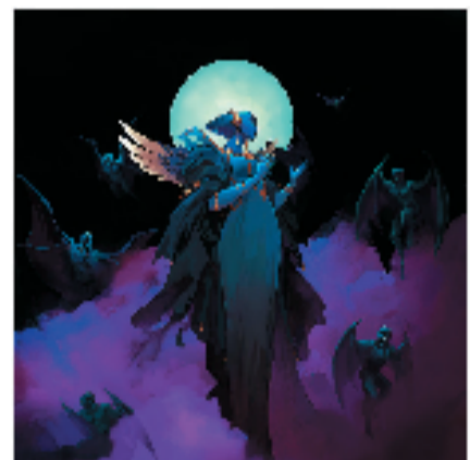
新月下的守护者——青月

《新月下的守护者》，是从一个异世界进入到新世界。异质，也许就是新血包，魔幻感十足。轻金属轻哥特风中，又飘过几缕水墨画的晕染感，漫漶了某种边界。那些生命，是成佛还是成魔，全靠自己了。