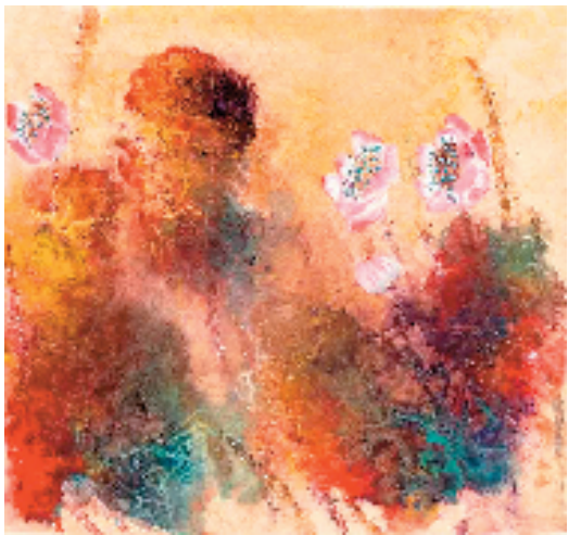
谢天成 金尘飘落蕊 国画

本报讯 苏园 由北京画院、刘海粟美术馆主办,北京画院美术馆承办的“彩韵墨象——谢天成艺术作品展”于3月20日在北京画院美术馆举办。