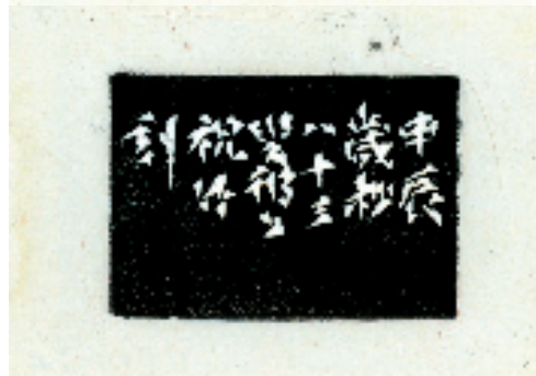
祝竹 一味天真得古欢