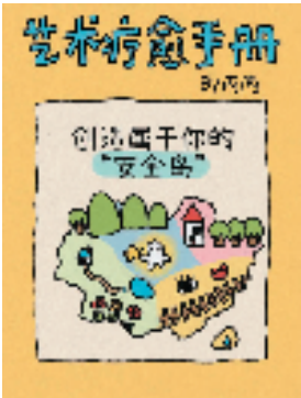
丙丙创作的艺术疗愈插画