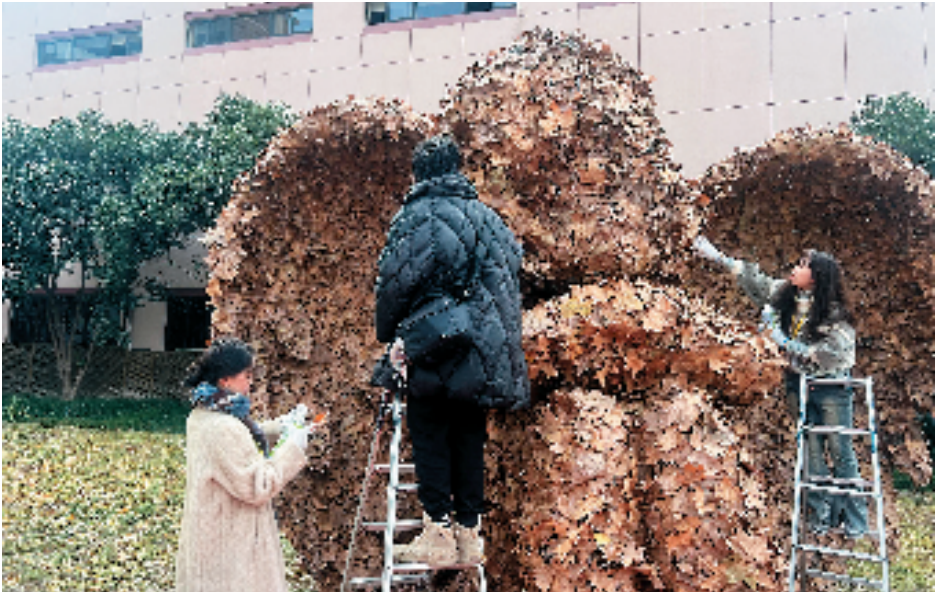
中国美术学院联合浙江大学医学院附属邵逸夫医院举办了“生命之美”艺术疗愈主题创作展览