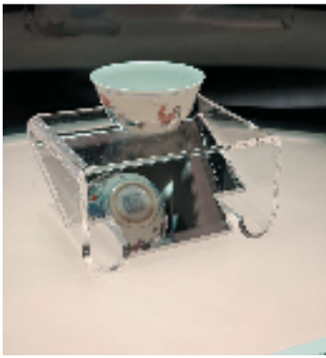
明成化斗彩鸡缸杯

展出文物皆是重量级名品,让观者心心念念的明成化斗彩鸡缸杯再次亮相,距离上一次上海市民见到它,已有十年之久。更多珍贵文物系首次面向公众展出:商代甲骨刻辞(34例),涉及祭祀、征伐、田猎、求雨、入贡;西周宣王五年青铜兮甲盘,刻133字铭文,是流传年代最久远的国宝重器;战国青铜错金银嵌琉璃乳钉纹方壶,工艺繁缛,色彩绚丽,代表了战国奢华工艺的巅峰;汉跪坐吏玉灯、盘,迄今考古发掘和传世遗存的唯一可见玉雕礼俑,极具考古标型价值;北宋汝窑天青釉洗,釉如凝脂,