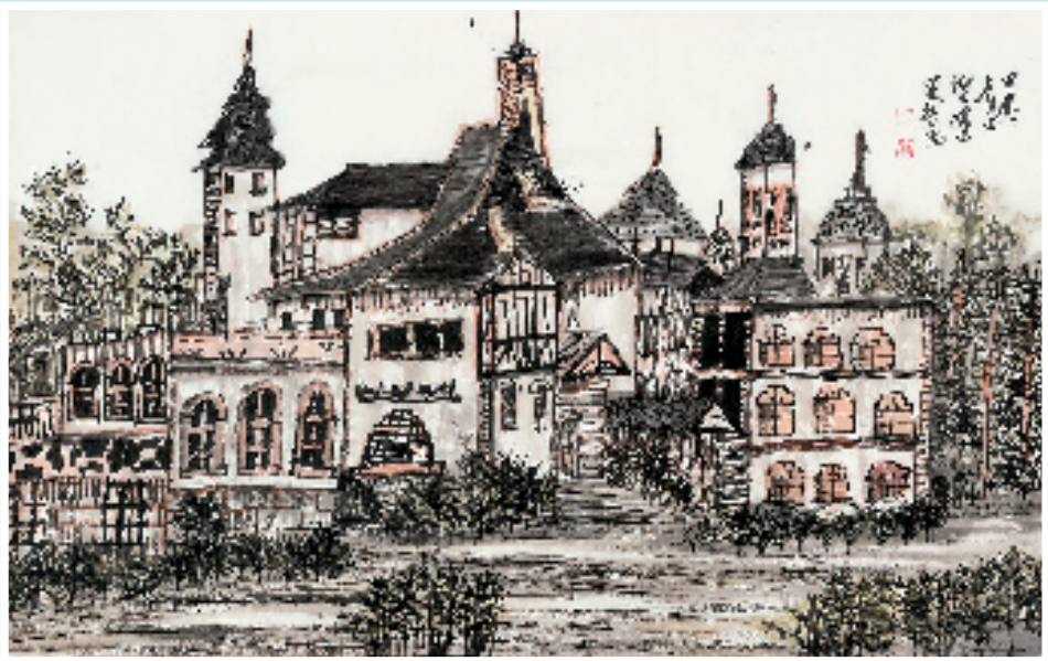
吴旻哲 故园一隅 68×34cm 水墨