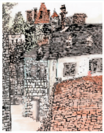
吴旻哲 城市转角 45×34cm 水墨