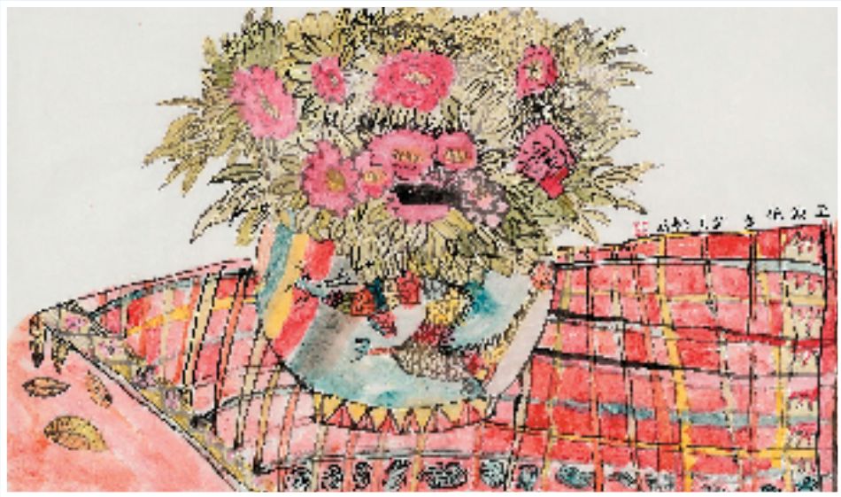
吴旻哲 玉颜艳春彩 68×45cm 水墨