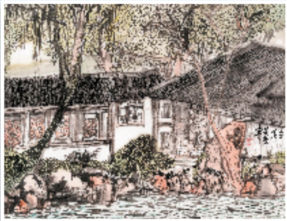
吴旻哲 姑苏且行 34×45cm 水墨