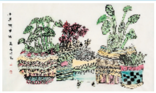
吴旻哲 千姿映眼眸 45×68cm 水墨