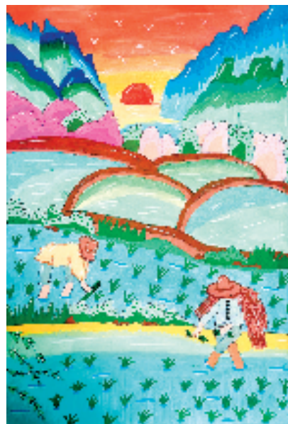
▲朱思奕(浙江省临海市河头镇中心校) 最美的身影 指导老师:郑慧 这幅画色彩丰富绚丽,夕阳、山峦与水田构成美丽背景,插秧人物动作自然,展现出田园劳作景象。