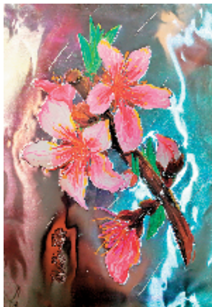
▲薛语诺(浙江省宁波市宁海县青少年活动中心) 桃花 指导老师:陈露露 这幅画以独特材质呈现桃花,色彩柔美绚丽,花瓣层次细腻,枝干与叶片生动,展现出春日花卉之美,颇具艺术表现力。