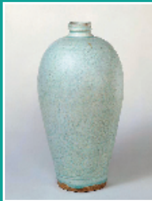
景德镇窑青白釉刻花梅瓶 故宫博物院藏

我之前在介绍北宋定窑白瓷时讲过，北宋早期普遍使用仰烧法，烧造白瓷唇口、葵口碗，青白瓷也一样。这一时期的产品，造型简单，瓷胎较厚，釉色偏灰或米黄；多光素无纹饰，尚不具备影青瓷的基本特征。从窑址调查和纪年墓出土情况来看，影青瓷初创时期大约在宋太祖建隆至宋真宗大中祥符年间。北宋中晚期，景德镇湖田窑（这是影青瓷最知名窑口），开始选用表层风化最佳的瓷石原料，淘洗澄湛工艺逐渐完善，胎、釉中铁元素的含量极低，拉坯成型技艺日趋成熟。优质影青瓷器多采用匣钵