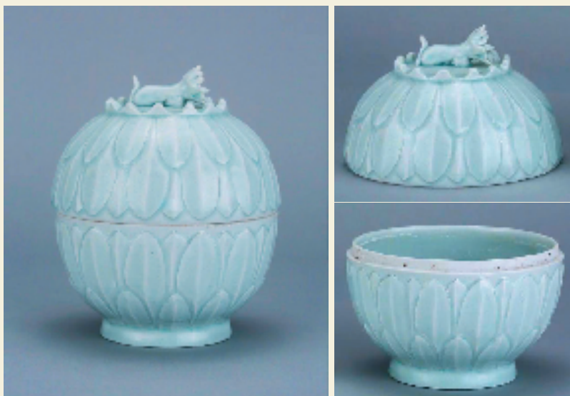
景德镇南宋影青釉刻花莲瓣纹盖盅 观复博物馆

影青瓷不仅造型美，而且装饰技艺更是独步青云，特别是刻花、划花技法，表面装饰的娃娃纹、莲纹、水波纹等，构图饱满，线条流畅，洋溢着浓郁的艺术灵感和生活气息。【如图】