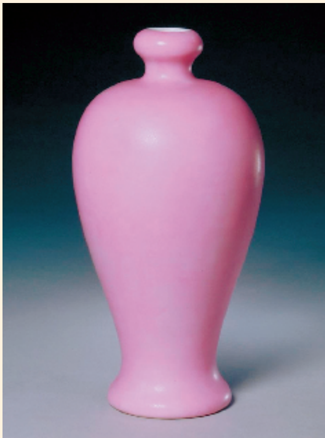
清 雍正时期 淡粉釉瓶 北京故宫博物院藏

了解完“胭脂水釉”的技艺，接下来，小颜将带领同学们从雍正时期穿越至乾隆年间，欣赏一下由“粉彩”工艺带来的视觉盛宴！这件现藏于苏州博物馆的粉彩绿里荷花杯，向我们生动地呈现了“接天莲叶无穷碧，映日荷花别样红”的自然景象。它的外形犹如一朵盛开的荷花，侧边还镶有一片荷叶。杯身粉色的核心奥秘，藏在一种名为“玻璃白”的神奇釉料中。工匠以铅粉、石英粉与钾元素混合烧制出乳浊状的白色基底，再将进口的胭脂红彩与玻璃白按不同比例调和，创造出层次丰富的粉色体系。这种“由浓及淡、由实转虚”的粉色变化，绝非单一颜料可调成，而是需要工匠在绘制时根据花瓣弧度与光影角度，实时调整笔端颜料的浓淡，每一片花瓣的粉色过渡都是独一无二的，如天然花卉般不可复制。