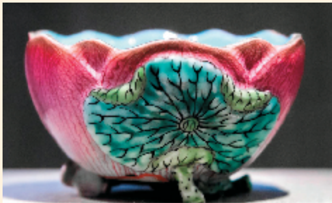
清 乾隆时期 粉彩绿里荷花杯 苏州博物馆藏