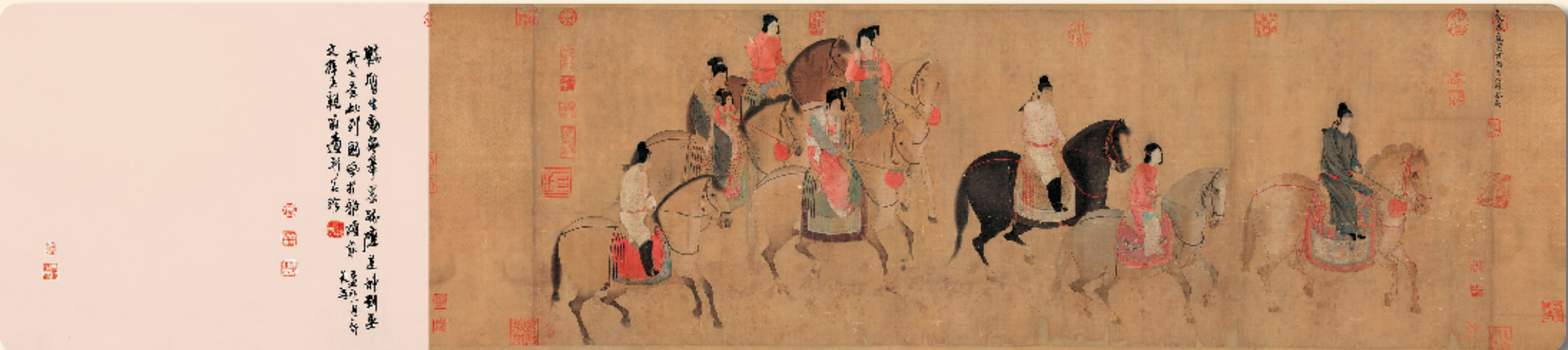
唐 张萱 虢国夫人游春图 52x148cm 绢本设色 辽宁省博物馆藏