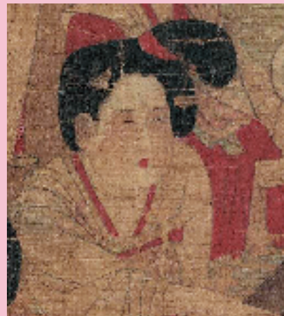
唐佚名 宫乐图轴局部 48.7x69.5cm 绢本设色 台北故宫博物院藏

《妆台记》描述道：“美人妆面，既傅粉，复以胭脂调匀掌中，施以两颊，浓者为酒晕妆；淡者为桃花妆；薄薄施朱，以粉罩之，为飞霞妆。”“桃花妆”早在隋代就已存在，宋代高承记载：“隋文宫中红妆，谓之桃花面。”至唐代开始盛行，它不仅在两颊处涂抹胭脂，眼险处亦然，唐代“桃花妆”的流行象征着社会开放与女性自信。