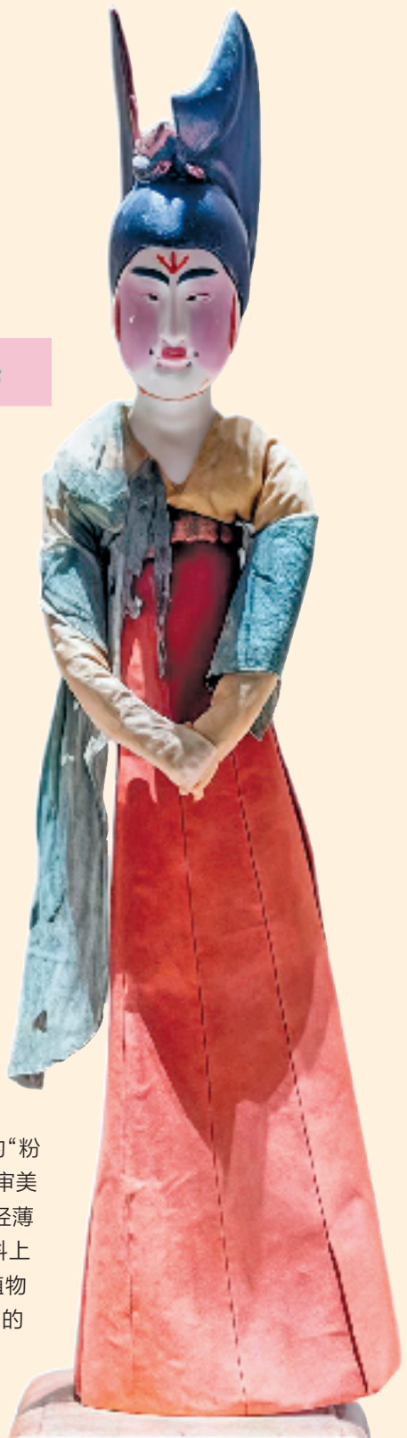
绢衣彩绘木俑 出土于吐鲁番阿斯塔那古墓群206号墓葬 新疆维吾尔自治区博物馆藏

唐代画家张萱则在作品《虢国夫人游春图》中，诠释了不同深浅的粉色。《虢国夫人游春图》是以盛唐贵族女性生活为题材，描绘了虢国夫人携眷出游的场景。其中服饰上的“粉色”作为重要的视觉元素，既体现了唐代贵族的审美趣味，也承载了丰富的文化意涵。画中人物以轻薄春衫为主，几位少女身着“胭脂红窄袖衫”，衣料上的桃红色调由矿物颜料（如朱砂混合白粉）或植物染料（茜草根）调制而成，呈现出柔而不失明艳的质感。画家采用“平涂”与“晕染”相结合的方式，使“粉色”呈现出从浓到淡的渐变层次。这样以“粉色”来表现“石榴裙”的例子也可以在明代画家仇英《汉宫春晓图》等古画中可以窥探到哦！