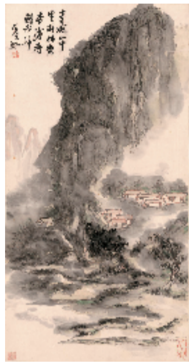
黄宾虹 青城坐雨图轴 浙江省博物馆藏

示，家族捐赠的万余件艺术藏品在馆方精心整理下得以在新时代焕发光彩，黄宾虹的一生与浙江渊源深厚，令人重温他的艺术成就，更需传承他“师古不泥古”的精神。