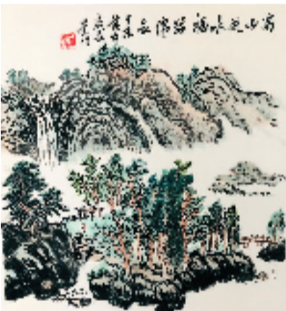
盛长荣 高山流水福缘长 69x69cm

据悉,本次展览由浙江省老领导陈加元、孙文友分别题写展名,浙江省老领导黄旭明、张鸿铭出席开幕式并剪彩祝贺,何虎将军宣布展览开幕。