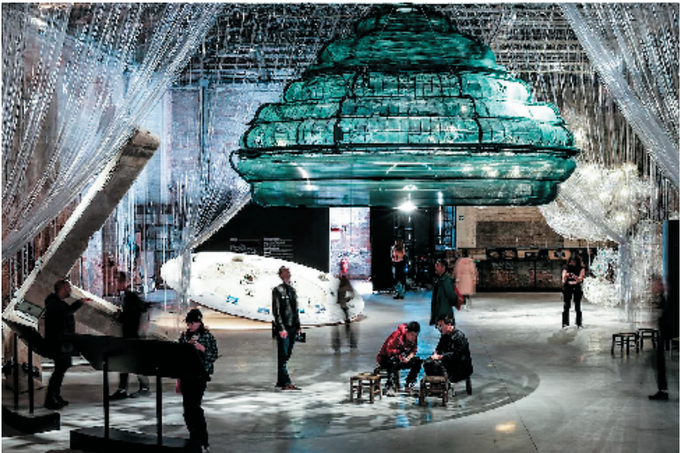
第19届威尼斯建筑双年展中国馆现场

“良渚十二律”不仅是对中华文明的活化,更构建起跨越时空的文明对话机制。项目以“十二律”为框架,启动以知识领域的“十二分野”为“人文周天”的“文明互鉴”,将长期世界寻访计划通过声音装置转化为在良渚全域的投射,良渚因此成为生态文明时代满天星斗交相辉映的“世界投影”。