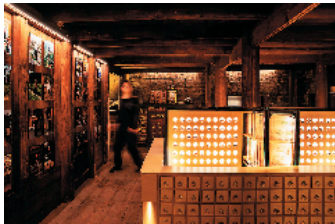
“以食为天”米兰三年中国展区现场