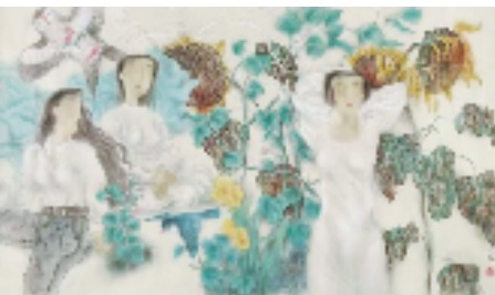
马小娟 正午的梦 82.5×144cm

往艺术创作的一次洗礼,仿佛一场漫长而充实的旅行,看着参展作品如同熟悉又陌生的老友,令自己想起一路前行的辛苦与收获的满足。这些作品不仅是心血结晶,更是自身对生活和艺术的思考与探索。