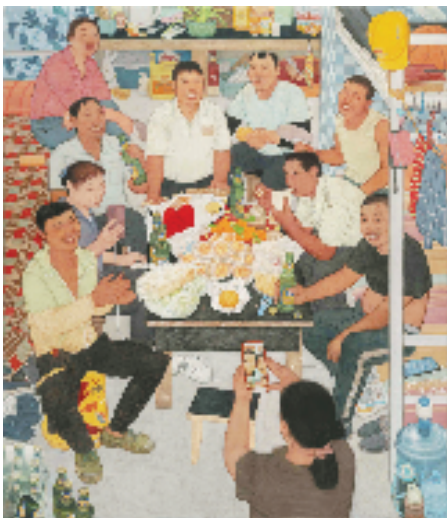
李传真 暖阳 纸本设色 240cm×210cm

展览通过“筑基·潮痕”“守望·暖阳”“群像·实录”“多元·共生”四个精心策划的主题单元,引领观众深入探索劳动者的多重世界与时代印记。作为中国当代现实主义人物画领域的重要代表,此次展览不仅是艺术家李传真的首次大型个展,更是一次对其20年来聚焦“劳动者”主题艺术探索的全面梳理与深度呈现。展览汇集了李传真精心创作的44件绘画作品及多部珍贵影像资料,围绕“老一代农民工”“新农村留守老人与儿童”以及“新生代产业工人”这三大群体构建起清晰的叙事主线。艺术家通过纸本设色、绢本设色、素描、装置、影像等多元媒介的综合运用,巧妙构筑起“二维叙事+三维场景+跨媒介交互”