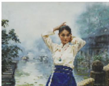
潘鸿海 水乡少女 73×92cm 1996年 浙江美术馆藏

精准的捕捉。他把来自西方的写实技法与中国古典美学的诗性意韵相结合,来表述具有东方特色及审美的中国当代乡土风情,深入发掘江南水乡的人文情致与田园韵味,淬炼出具有东方诗意抒情的作品。他的作品不仅引领着试图描绘江南的油画后来者,更是将江南的深厚美学底蕴进一步推向人们的视野中。