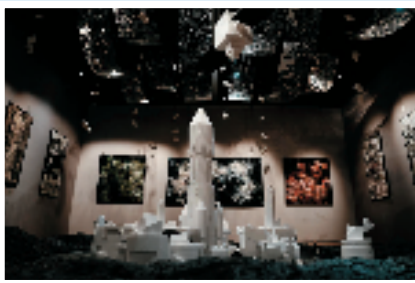
蔡静琪 银河画卷 立体造型