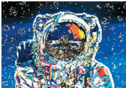
蔡静琪 梦星空 水粉画