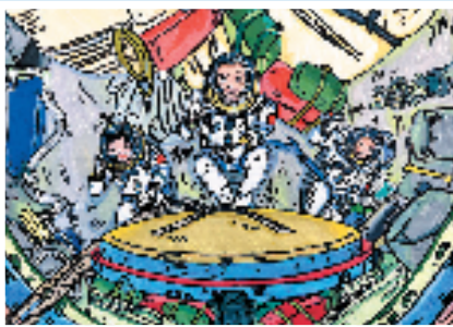
蔡静琪 神舟发射 水粉画