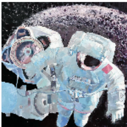
蔡静琪 出仓 油画