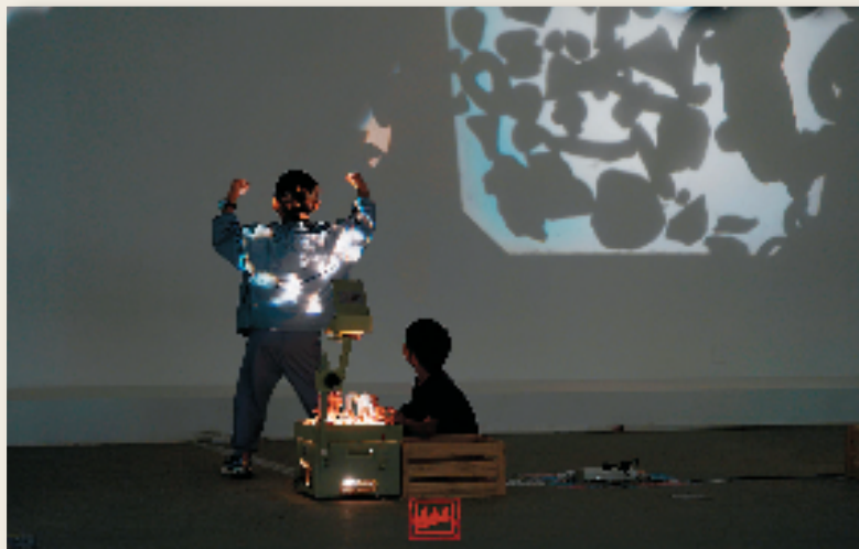
碎泥片的二次创作与光影互动