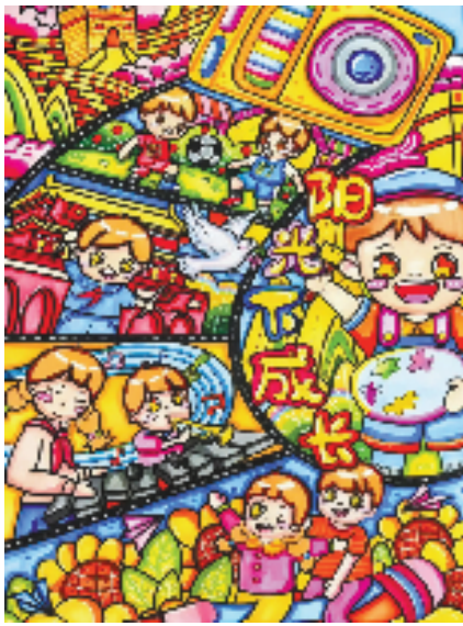
邱书源(浙江省嘉兴市嘉善实验小学北校区) 童年调色盘 指导老师:吴晓燕 作品以调色盘构图布局,色彩斑斓,多格画面记录孩子活动,搭配地标建筑,满是童真。