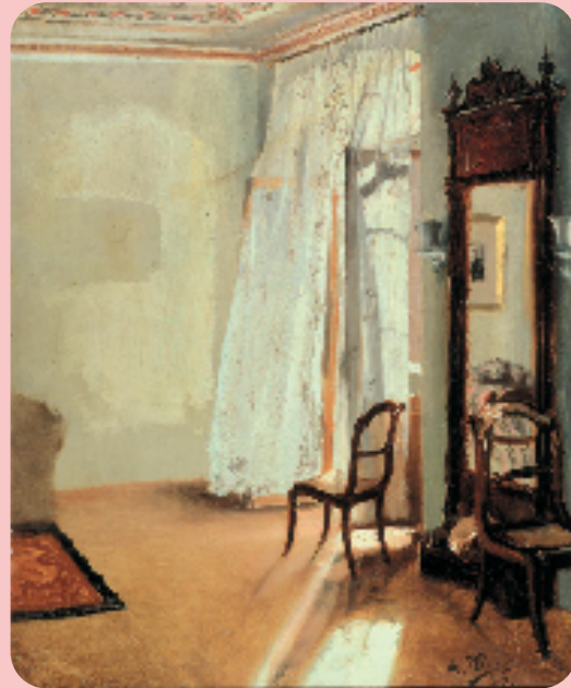
门采尔 有凉台的卧室 布面油画 1845年 柏林国家美术馆藏