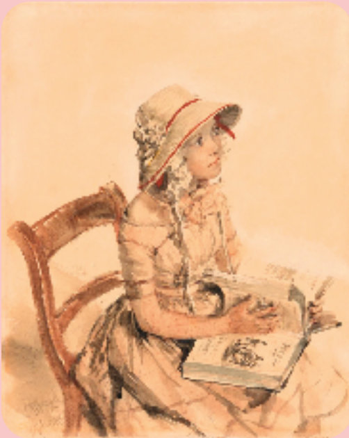
门采尔 卡尔·冯·梅尔克博士女儿的肖像 纸本水彩

门采尔的艺术道路漫长曲折,但他始终与时代同步前行。凭借着百分之一的天赋和百分之九十九的勤奋,门采尔成为享誉世界的艺术大师。门采尔自18岁那年因“天赋不足,难成大器”的“判定”,而再也没有接受过正规的学院艺术教育。纵观他的一生,不免想到这个由来已久的话题:“艺术大师”又真的都是艺术学院教出来的吗?