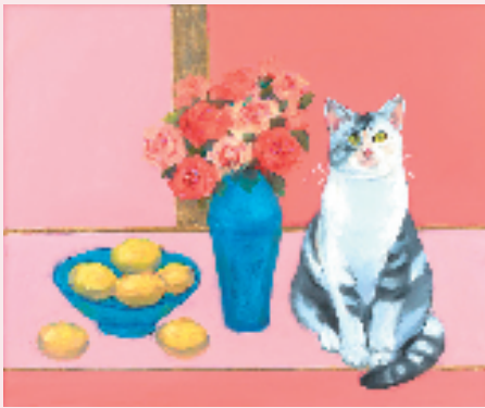
李宏伟《猫美术馆》系列