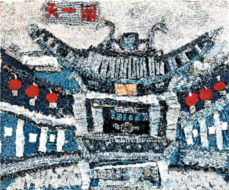
宁波市爱菊艺术学校集体创作《布上宁波》

学生常说,在爱菊,我们不仅学会了用画笔描绘世界,更掌握了用艺术思维解构难题的钥匙。这种将艺术感知力转化为综合素养的育人成果,正是学校“以艺育人、健康成长”办学理念的最佳印证。