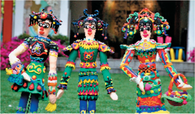
宁波市爱菊艺术学校集体创作《剪花娘子——库淑兰剪纸艺术立体再现》

作品说明: 这件作品以一条长长的“贪吃蛇”为主体,用四棱锥作为基本单元,通过纸艺、传统纹样与光影效果相结合,传递了对中国传统文化的致敬与现代创意的表达。“贪吃蛇”不仅象征着灵动与生命力,同时也寓意着探索与成长的过程。而四棱锥内散发的温暖光芒则象征着知识的启迪与文化的传承。