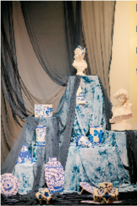
宁波市爱菊艺术学校集体创作《中国有“画”说》

作品说明: 民间剪纸大师库淑兰的作品以简洁明快色彩绚丽,描绘着一幅幅生活百态图。80多岁的她重复的表现着一个神秘主题“剪花娘子”的创作。这个女神雍容华贵仪态万方,她既是库淑兰的心中偶像又是一个完美的艺术构图:“大脸盘高鼻梁,肤色白皙眼睛大眼黑多口型小”的人是为美人。学生运用黏土,通过揉、团、搓、捏、接等方法,将平面艺术拓展到立体艺术,让剪纸作品中的剪花娘子走出画纸,好似成了活生生的美人。