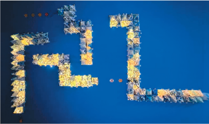
宁波市爱菊艺术学校集体创作《灵蛇耀光》

作品说明: 这件用牛仔布制作的宁波地标性建筑作品不仅是学生团队创造力和动手能力的展示,更承载了对宁波城市文化的深刻理解。通过使用牛仔布这一现代感十足且具有环保意义的材料,赋予了传统建筑新的表现形式,象征着宁波在传承历史文化的同时,也不断融入现代化元素,走向更具创新和包容性的未来。