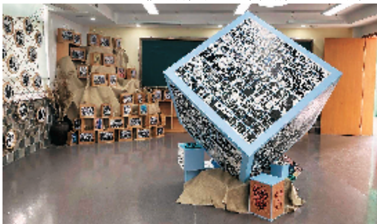
嘉兴市南湖区余新镇中心小学渔里美术馆