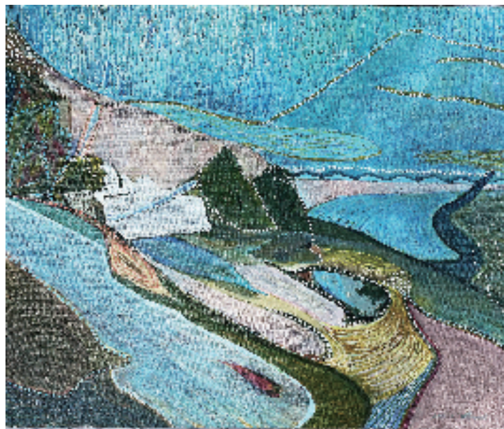
罗阳竹(浙江省杭州第七中学) 再造景观拼贴 油画