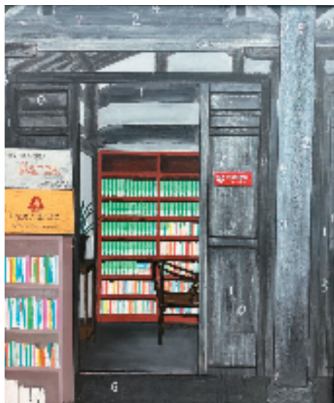
寿伟克(衢州学院) 乡村书屋 油画