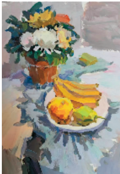
钱晨(天津美术学院) 静物 水彩