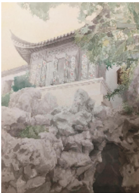
沈赛格(杭州第七中学) 山望 中国画