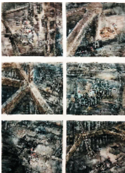
郑秀锦(平湖市东湖小学) 前行 水彩