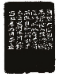
李立 大匠之门(连款)