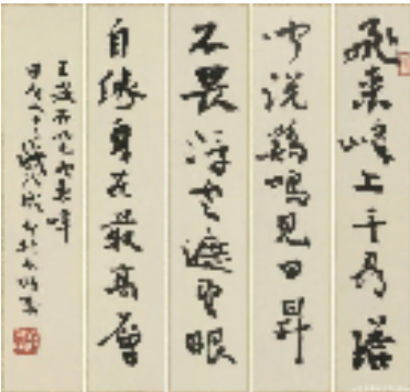
36.2x7.5cmx5 2024年 钱法成 登飞来峰