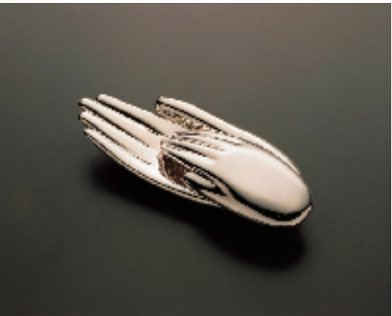
1997年设计的香港回归纪念银器《手牵手》

你不一定知道他的名字，但一定看过他设计的作品。1981诞生的中国银行行徽、香港回归纪念银器《手牵手》、“1970年世博会”海报，这些都出自国际著名平面设计师、中国文联香港会员总会顾问靳埭强先生之手。