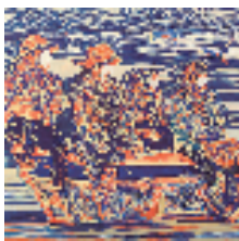
俞舟波 金色年华 180x182cm 2024年