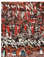
胡凤娜 盛世渔歌 113x152cm 2024年