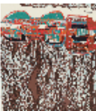
包凤俾 海南彩色电生 112x123cm 2024年