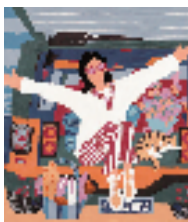
张芬燕 夏日海边 59x68cm 2025年