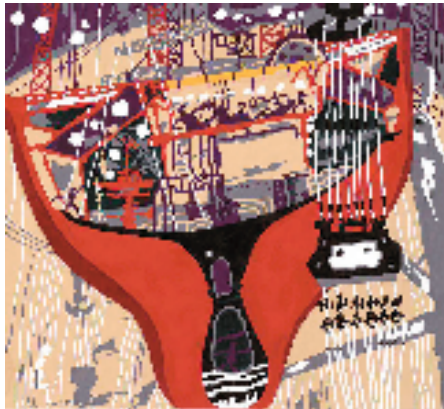
朱国安 船坞 65x67cm 2020年