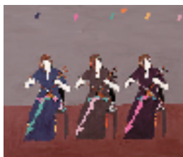
王玲玲 樟州乡村音乐社 96x115cm 2024年