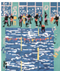
孙倪儿 清凉一夏 79x70cm 2024年