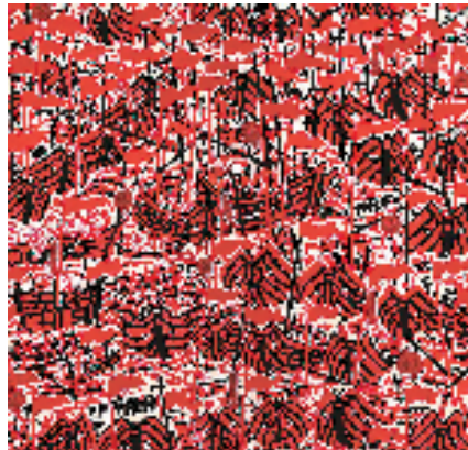
朱松祥 红旗飘飘正待发 140x140cm 2024年