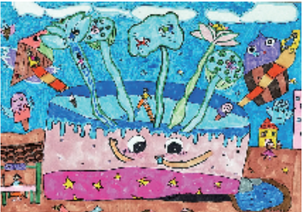
徐心悦(浙江省义乌杭州育才学校) 蒲扇摇夏天 指导老师:朱晗祺 这幅画把泳池变蛋糕,用鲜亮色彩、稚拙笔触描绘出莲花上的小人、冰淇淋风筝等,拼出夏日奇妙世界!