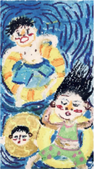
徐梓诺(浙江省台州市山海幼儿园) 泡在水里的夏天 指导老师:周芷君 以稚拙笔触勾勒人物,用明快色彩渲染水波,泳圈灵动、神态鲜活,把夏日戏水的欢快与童真,满溢在画面的蓝与黄里,是孩子眼里夏天该有的模样。