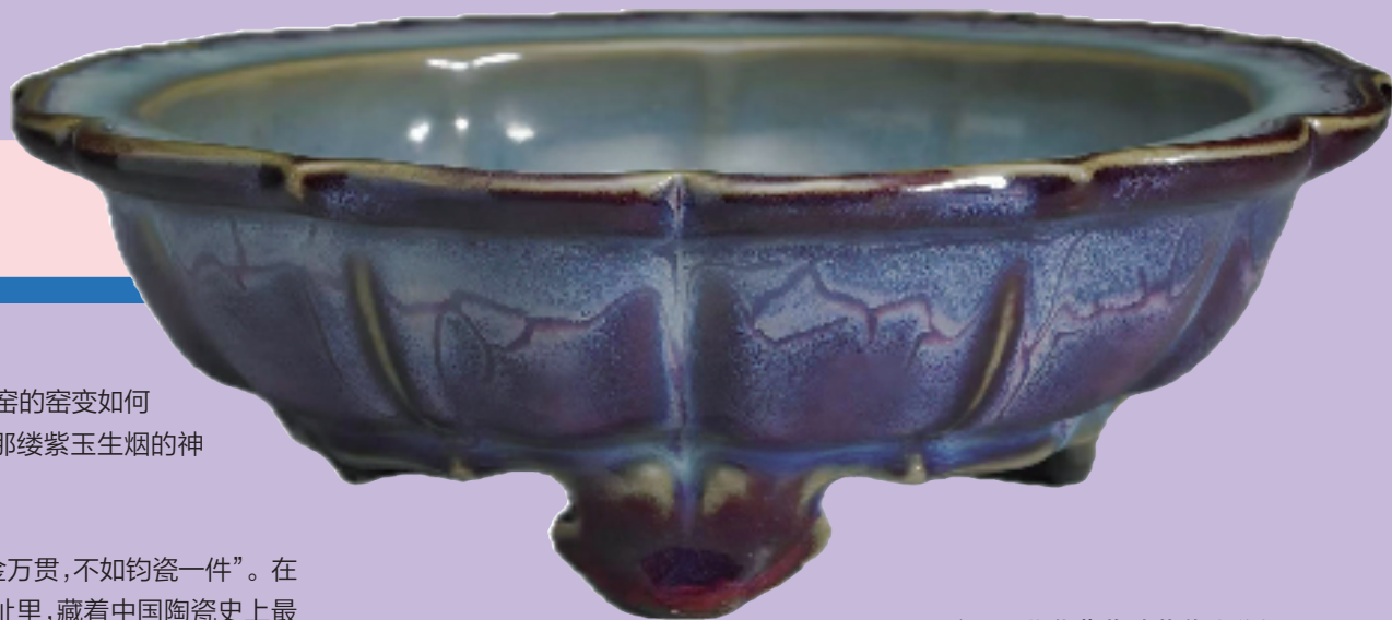
▲明初 天蓝葡萄紫釉莲花式盆托 钧窑 台北故宫博物院藏

这种变幻莫测的窑变工艺极难掌控。烧造匠人怀着忐忑的心情,也带有猜谜的快乐,等待着开窑的结果。无论是金元还是明初的作品,其釉色与斑纹都是独一无二的自然杰作。回溯其源,宋代钧窑所开创的这种青紫交融的瓷器,打破了当时南青北白的单色釉主流格局,成为极具特色的品种。其魅力如此之大,以至于被宫廷垄断为御用,并严格禁止民间仿烧。这种垄断地位在金元和明初的官钧产品中得到了延续。从此,承载着“紫玉生烟”之美的钧瓷,不仅是艺术的高峰,也成为权力与尊贵的象征。