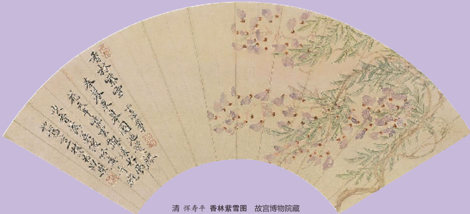
清 恽寿平 香林紫雪图 故宫博物院藏