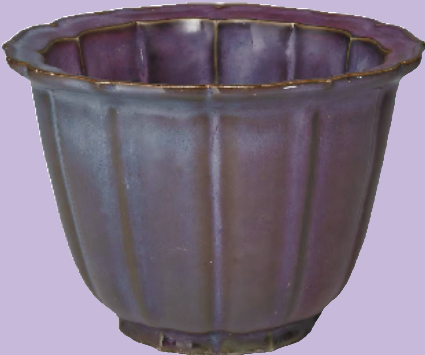
▼金·元 天蓝葡萄莲花式花盆 钧窑 台北故宫博物院藏