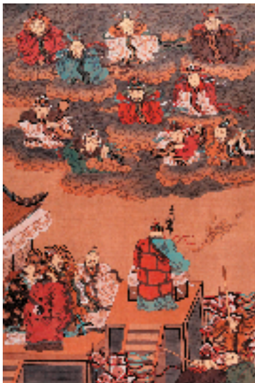
周京新 西游记——车迟国 1969 年

据悉,展览将持续至 2026 年 1 月 6 日。展期内,江苏省美术馆将策划举办系列学术研讨、艺术家分享及公共教育活动。