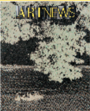
李青 阴翳志·艺术新闻 28x23.3x0.9cm 织锦包裹的杂志 2019年