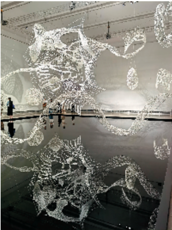
崔珍、托马斯·夏因 缩地 7.2x15.6x24.1m 涤纶绳,木质和金属结构 2025年 展览现场

的杭州纤维艺术三年展,延续着万曼先生“经纬天下”的哲思,一直专注于“纤维”这一独特领域,极大地拓展了雕塑艺术的边界与内涵,彰显了杭州独特的艺术视野。2015年率先在中国开创纤维艺术系,10年来,国美艺术家重视创作的持续开拓和实验,重视材料和空间形态的深入挖掘,积极参与国际展览与交流。2024年,施慧教授的