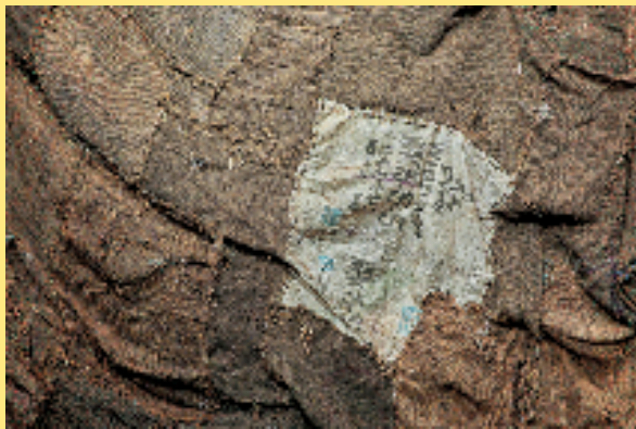
易卜拉欣·马哈马 无题 尺寸可变 黄麻麻袋 2013-2025年