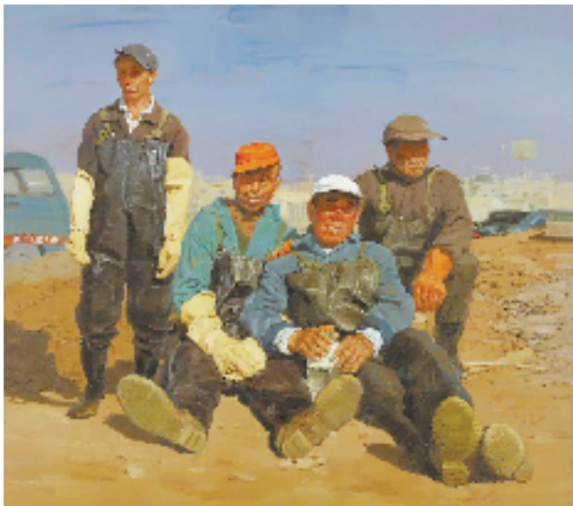
陆庆龙 工闲时分 180×200cm 布面油画 2009年 江苏省美术馆藏

本报讯 通讯员 宗洁 李岑洋 由江苏省美术馆主办、江苏油画雕塑院承办的文化和旅游部2025年度国家美术作品收藏和捐赠奖励项目“朴质的诗性——陆庆龙艺术作品展”于10月19日至11月4日在江苏省美术馆展出。 江苏省文化和旅游厅党组书记、厅长杨志纯,江苏省文联主席、省当代艺术创作研究会会长章剑华,江苏省政协副主席、民进江苏省委专职副主委余珽,上海师范大学美术学院原院长、上海油雕院原副院长、中国美协国家重大题材美术创作委员会委员俞晓夫,南京艺术学院原副院长、江苏省油画学会名誉主席沈行工为展览揭幕。第十四届全国政协副主席、民盟中央专职副主席吴为山,中国美术家协会主席范迪安发来贺信。 江苏省美术馆党总支书记、馆长王法在致辞中向陆庆龙表达了敬意,感谢他将50件代表作品慷慨捐赠给江苏省美术馆,并表示,作为2025年度国家美术作品收藏和捐赠奖励项目,本次展览是对陆庆龙40年艺术求索的全景呈现。数十年来为人民书写、为人民抒情、为人民抒怀,始终是陆庆龙的艺术初心,扎根大地是刻在他创作骨子里的底色。陆庆龙的此次捐赠不仅与江苏省美术馆高质量收藏的定位深度契合,更为收藏体系注入了鲜活的时代力量。