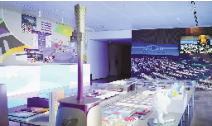
“大学望境——中国美术学院建设世界一流大学二十周年特展”现场

2002年12月，时任浙江省委书记的习近平同志亲临美院考察，走遍南山、滨江、象山三大校区，为校园规划与名校建设擘画蓝图；2005年校庆之际，再次莅临调研新学科发展，提出“建设世界一流美术学院”的殷切期望，并在象山北麓亲手种下杜英树，将期许植根山水与师生心间。2006年2月，浙江省委常委专题听取美院工作汇报，明确“创建世界一流大学”目标，相关要求正式写入省级教育规划，赋予美院“彰显中国文化艺术最高水平、服务文化大省建设”的光荣使命。自此，“杜英树下成长的一代”成为国美学子的鲜明标识，高峰建校的嘱托融入师生精神血脉，引领学校踏上跨越式发展之路。