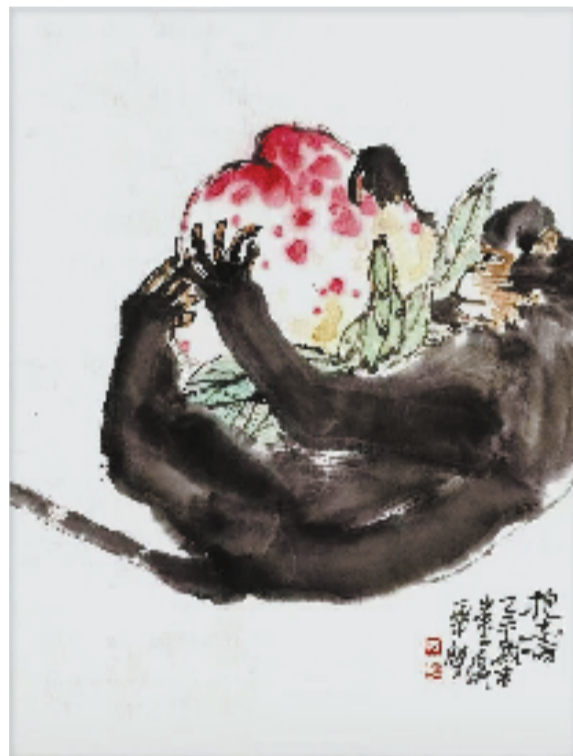
赵华 抱寿 纸本设色