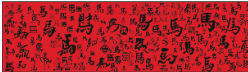
由市民网友共创的《万马奔腾》书法装置艺术作品

大同日报讯 通讯员 郝雨 2月14日，“骐骥万里 春满古都”“木兰杯”2026马年新春春联书法展开幕式在大同市雕塑博物馆举行。展览由大同市委宣传部指导，市文明办、市文物局、大同日报社联合主办，是2026马年新春征联活动的核心展示项目。活动前期面向全社会广泛征稿，各界书法爱好者与市民踊跃参与，经严格遴选，一批主题鲜明、格调高雅、笔墨精湛的佳作集中亮相。