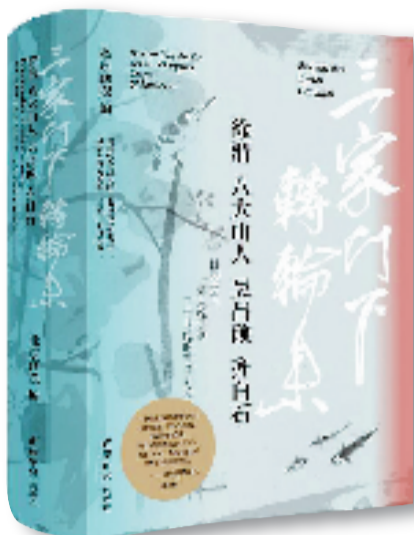
·《三家门下转轮来： 徐渭 八大山人 吴昌硕 齐白石》 ·北京画院/编 ·西泠印社出版社/出版