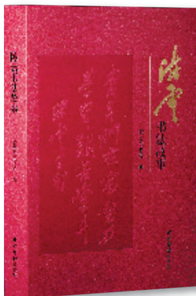
·《陈云书法故事》 ·陈云纪念馆/编著 ·西泠印社出版社/出版

本书编者表示，书中的文字、藏品、图片等一个个细节串起谭敬跌宕起伏的一生，也勾勒出近现代上海的文化脉络与时代变迁。翻开这本书仿佛穿越百年时光，遇见谭敬，遇见那个动荡而又充满希望的年代，在沧海桑田的变迁中，了解这位被历史遗忘的传奇人物，读懂他所处时代和文化在其身上打下的深深烙印。(沈思扬)