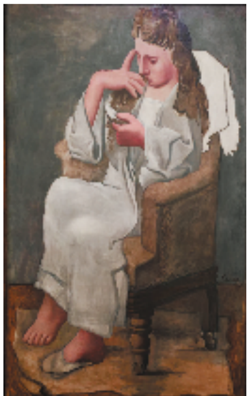
毕加索(西班牙) 阅读的女人

例如黄色,展览指出在西方“黄色的意义最负面”,骗子和说谎者通常身穿黄色服装,在体育中惩罚犯规的运动员,所以有“黄牌警告”一说。在我国则把黄色视为光明的象征,队旗上的星星和火把不就是指向光明前程的黄色吗?同样是西方人的凡·高,他画的向日葵系列,却强烈地表达了他对光明的向往。这正好说明现代艺术家在色彩上不受任何传统、文化的约束。