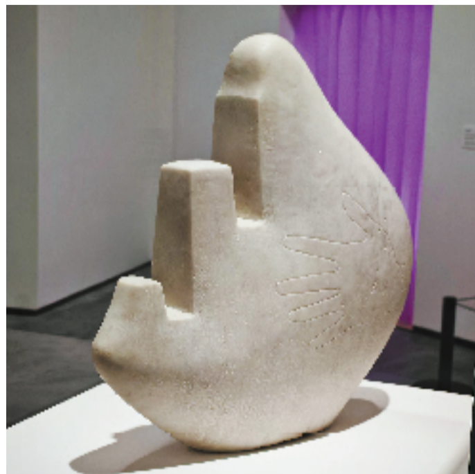
▲ 阿尔贝托·贾科梅蒂(瑞士) 爱抚(白色)

贾科梅蒂是现代著名的雕塑家，他的作品多是一些细长的人物，颜色以黑色为主。这件作品是他早期的作品，是展览中唯一一件雕塑作品，再加上是白色的，格外吸引观众。作品题为《爱抚》，可是艺术家怎样表达的爱抚呢？你仔细地看看作品，和小伙伴讨论一下吧！