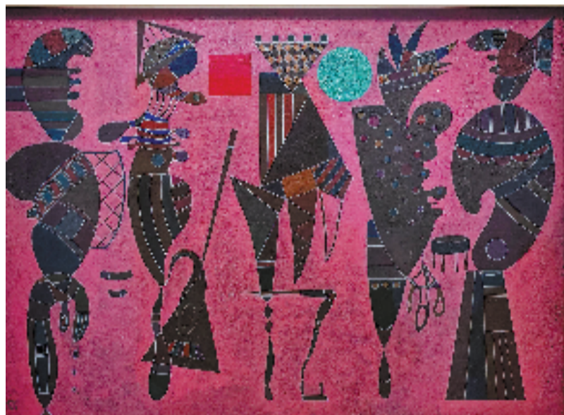
▲ 瓦西里·康定斯基(俄) 圆与方(粉色)

贾科梅蒂是现代著名的雕塑家，他的作品多是一些细长的人物，颜色以黑色为主。这件作品是他早期的作品，是展览中唯一一件雕塑作品，再加上是白色的，格外吸引观众。作品题为《爱抚》，可是艺术家怎样表达的爱抚呢？你仔细地看看作品，和小伙伴讨论一下吧！