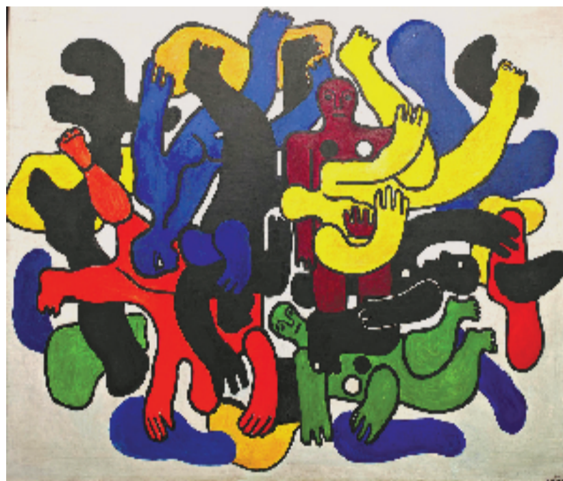
▲ 费尔南·莱热(法) 黑色的潜水高手(黑色)

康定斯基是一位有着极高的音乐修养的画家，他认为色彩是心灵的交响乐。二次世界大战期间，德国的纳粹污蔑他的作品为“堕落的艺术”，并将其作品禁展。画面上那些黑色的造型沉重、有力，是理性和生命的象征，粉色在这里象征着未熄灭的生命之火，和康定斯基以前画的抒情性作品完全不同了。这幅作品是画家在1943年创作的，就在那一年他去世了，可惜的是他没有看到二次世界大战的胜利。