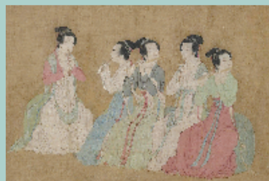
五代 顾闳中 韩熙载夜宴图(局部) 故宫博物院藏