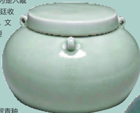
明 翠青釉三系盖罐 故宫博物院藏