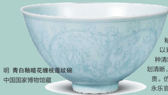
明 青白釉暗花缠枝莲纹碗 中国国家博物馆藏

从宫廷意外诞生的奇色,到古画中定格的情影,天水碧以清润灵动的特质,成为五代至宋代碧色服饰的核心代表。它不仅是一种服饰色彩,更承载着古人的织染智慧与审美情趣,并在历史上留下了一抹不可替代的青碧余韵。