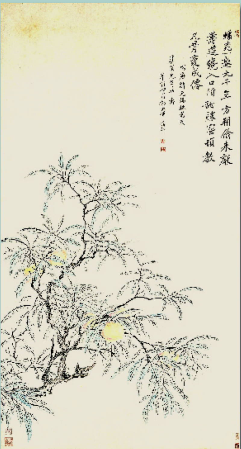
恽寿平 蟠桃图 广州艺术博物院(广州美术馆)藏

小朋友们!你们见过自带“长寿密码”,还裹着温柔碧色的神奇画作吗?就是这幅藏在广州艺术博物院(广州美术馆)的“国宝级宝贝”——清代恽寿平《蟠桃图》!它可是国家一级文物哦,不仅画技超绝,还藏着传统色彩的小知识,快跟着小颜一起解锁它的精彩吧!