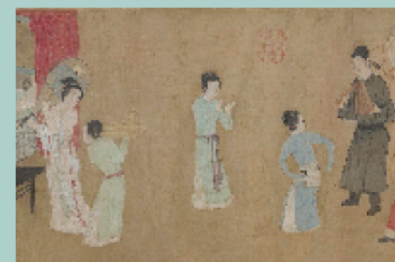
五代 顾闳中 韩熙载夜宴图(局部) 故宫博物院藏

看完这三款碧色器物,你是不是瞬间被碧色的魔力圈粉啦?从宋代的汝窑天青釉圆洗,到明代的翠青釉三系盖罐、青白釉暗花缠枝莲纹碗,古人超会玩!他们用瓷土这些材料,经过烧制、刻划等各种神操作,把碧色演绎得淋漓尽致:天青釉莹润如玉,翠青釉鲜亮似春,青白釉光洁如水。碧色看起来低调沉静,其实藏着满满的生机与活力,就像一片浩瀚森林,静待古人用智慧与巧手,解锁最美器物美学!