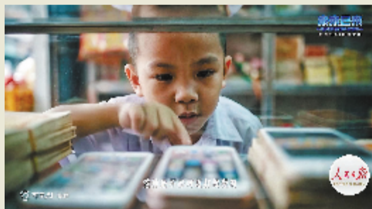
短剧《纸手机》视频截图