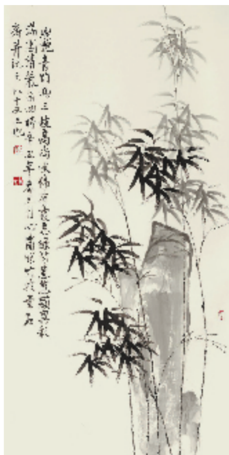
龚心甫 高洁淡泊 136x68cm 水墨纸本