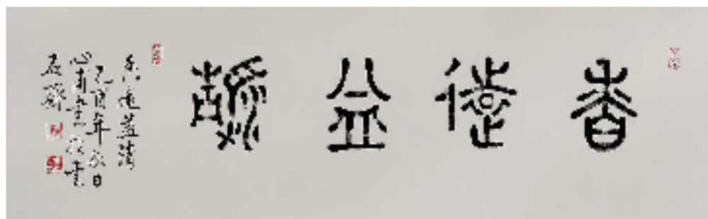
龚心甫 香远益清(大篆) 33.5x110cm 纸本水墨