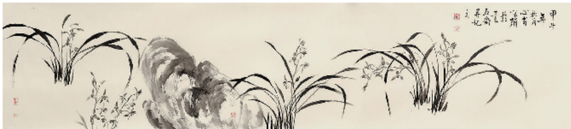
龚心甫 香远益清 53x235cm 水墨纸本