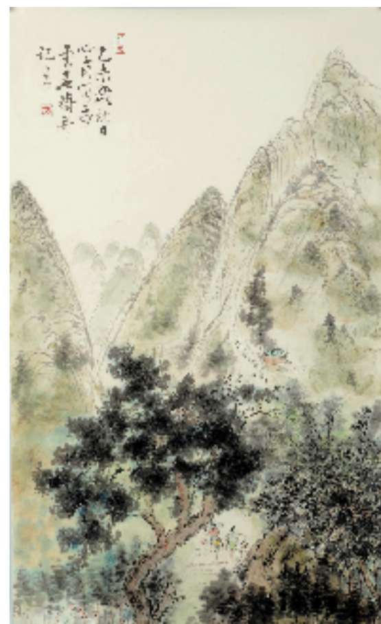
龚心甫 晨曦清气 97x59cm 纸本设色