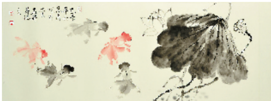
龚心甫 互爱图 48x123cm 纸本设色

届时举行龚心甫精品画作捐赠仪式（20幅）作品由宁波市天一阁博物院永久收藏，仪式将由有关领导出席。