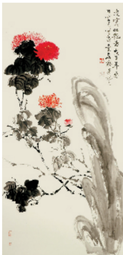
龚心甫 凌寒吐艳图 139x68cm 纸本设色