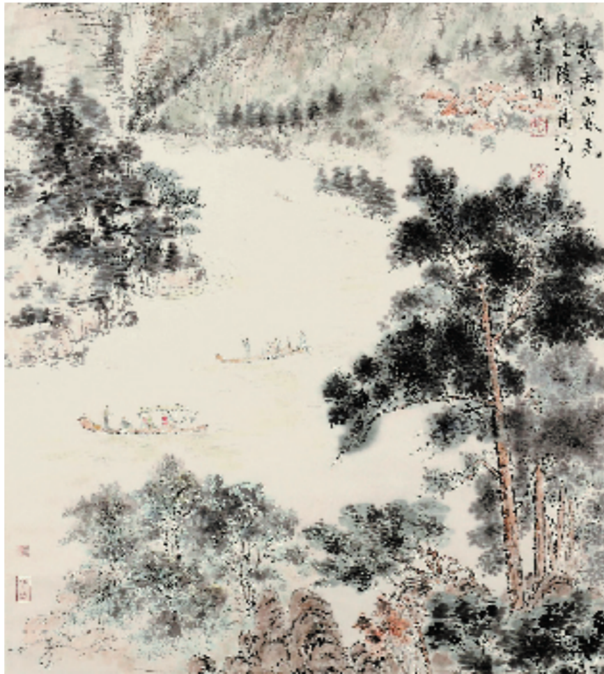
龚心甫 武夷山风光 77x69cm 纸本设色