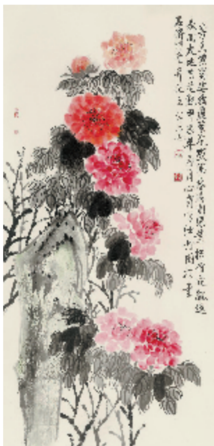
龚心甫 牡丹图 136x68cm 纸本设色